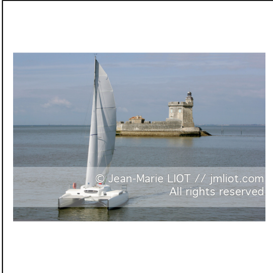
Charente et sud de la baie de la Rochelle.Sud Oleron.