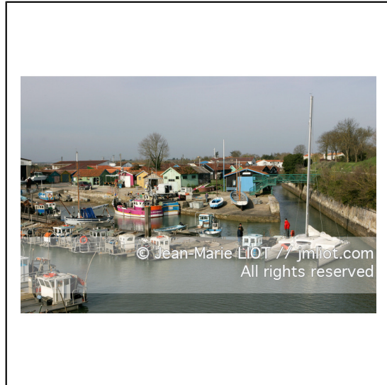
Charente et sud de la baie de la Rochelle.Sud Oleron.