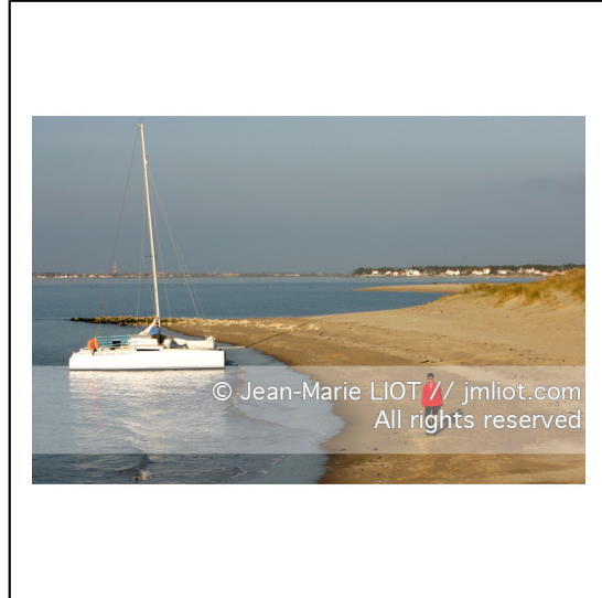
Charente et sud de la baie de la Rochelle.Sud Oleron.