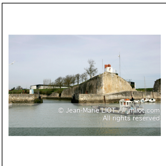
Charente et sud de la baie de la Rochelle.Sud Oleron.