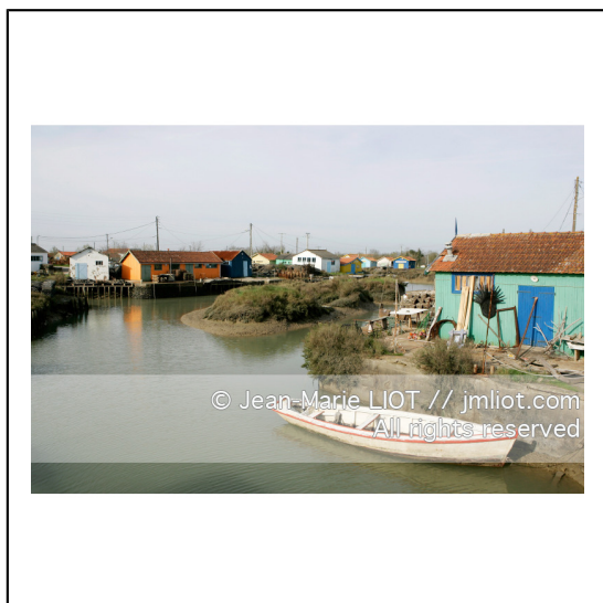
Charente et sud de la baie de la Rochelle.Sud Oleron.