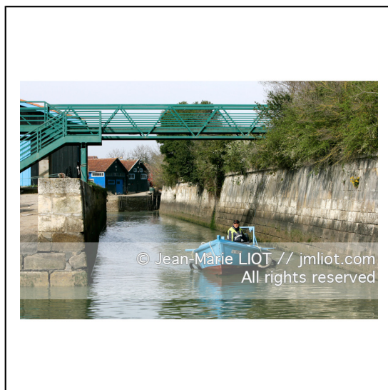
Charente et sud de la baie de la Rochelle.Sud Oleron.