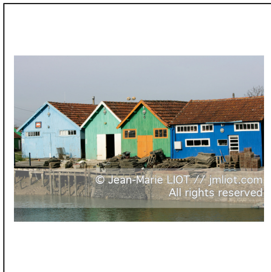
Charente et sud de la baie de la Rochelle.Sud Oleron.