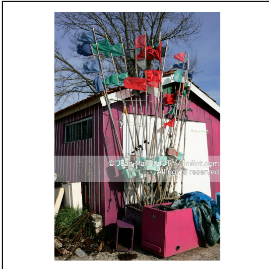
Charente et sud de la baie de la Rochelle.Sud Oleron.