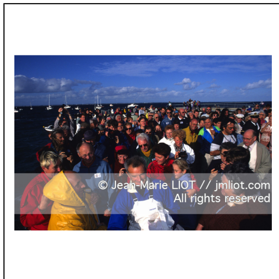
Septembre 1995, mise à l'eau de Pen Duick en présence de son skipper Eric tabarly, après rénovation par l'Ecole Nationale de Voile..Photo © Jean-Marie LIOT.###.September 1995, Launching Pen Duick with his skipper Eric tabarly, after complete refit by l'Ecole Nationale de Voile..Photo © Jean-Marie LIOT.