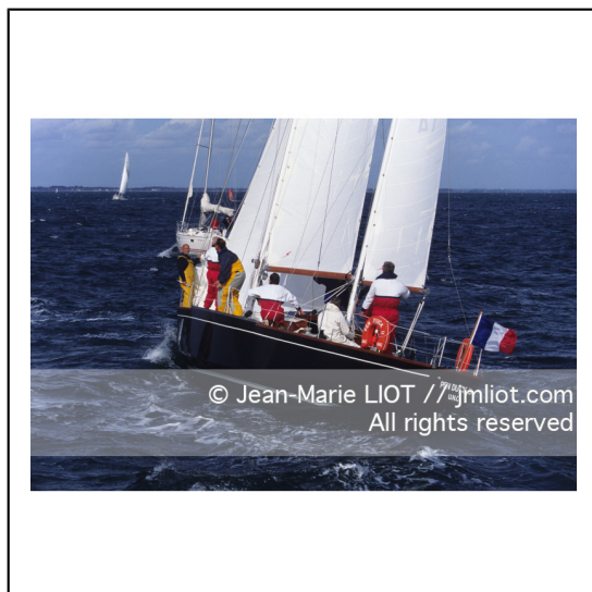
Septembre 1995, mise à l'eau de Pen Duick en présence de son skipper Eric tabarly, après rénovation par l'Ecole Nationale de Voile..Photo © Jean-Marie LIOT.###.September 1995, Launching Pen Duick with his skipper Eric tabarly, after complete refit by l'Ecole Nationale de Voile..Photo © Jean-Marie LIOT.