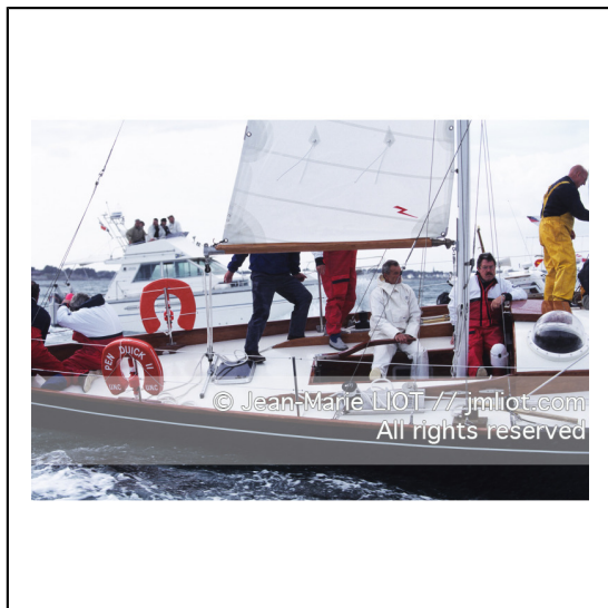
Septembre 1995, mise à l'eau de Pen Duick en présence de son skipper Eric tabarly, après rénovation par l'Ecole Nationale de Voile..Photo © Jean-Marie LIOT.###.September 1995, Launching Pen Duick with his skipper Eric tabarly, after complete refit by l'Ecole Nationale de Voile..Photo © Jean-Marie LIOT.