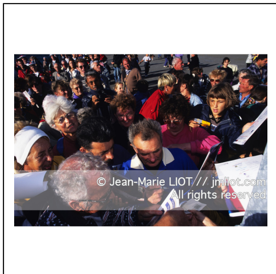
Septembre 1995, mise à l'eau de Pen Duick en présence de son skipper Eric tabarly, après rénovation par l'Ecole Nationale de Voile..Photo © Jean-Marie LIOT.###.September 1995, Launching Pen Duick with his skipper Eric tabarly, after complete refit by l'Ecole Nationale de Voile..Photo © Jean-Marie LIOT.