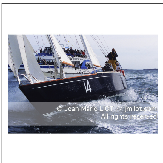
Septembre 1995, mise à l'eau de Pen Duick en présence de son skipper Eric tabarly, après rénovation par l'Ecole Nationale de Voile..Photo © Jean-Marie LIOT.###.September 1995, Launching Pen Duick with his skipper Eric tabarly, after complete refit by l'Ecole Nationale de Voile..Photo © Jean-Marie LIOT.