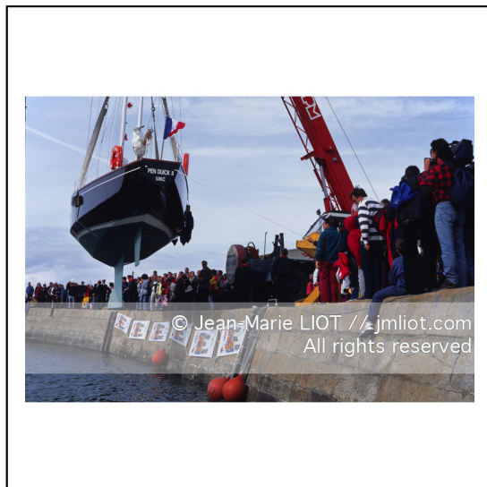
Septembre 1995, mise à l'eau de Pen Duick en présence de son skipper Eric tabarly, après rénovation par l'Ecole Nationale de Voile..Photo © Jean-Marie LIOT.###.September 1995, Launching Pen Duick with his skipper Eric tabarly, after complete refit by l'Ecole Nationale de Voile..Photo © Jean-Marie LIOT.