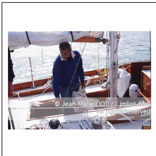
Septembre 1995, mise à l'eau de Pen Duick en présence de son skipper Eric tabarly, après rénovation par l'Ecole Nationale de Voile..Photo © Jean-Marie LIOT.###.September 1995, Launching Pen Duick with his skipper Eric tabarly, after complete refit by l'Ecole Nationale de Voile..Photo © Jean-Marie LIOT.