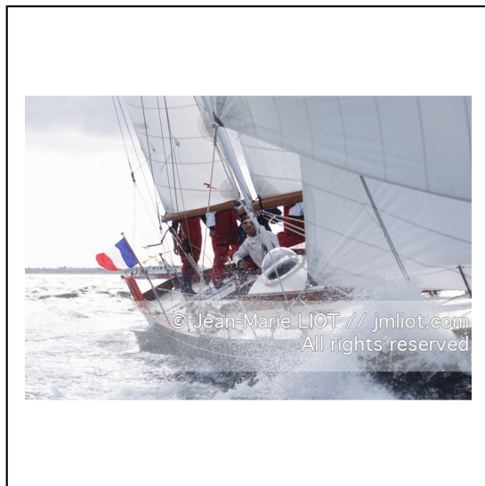
Septembre 1995, mise à l'eau de Pen Duick en présence de son skipper Eric tabarly, après rénovation par l'Ecole Nationale de Voile..Photo © Jean-Marie LIOT.###.September 1995, Launching Pen Duick with his skipper Eric tabarly, after complete refit by l'Ecole Nationale de Voile..Photo © Jean-Marie LIOT.