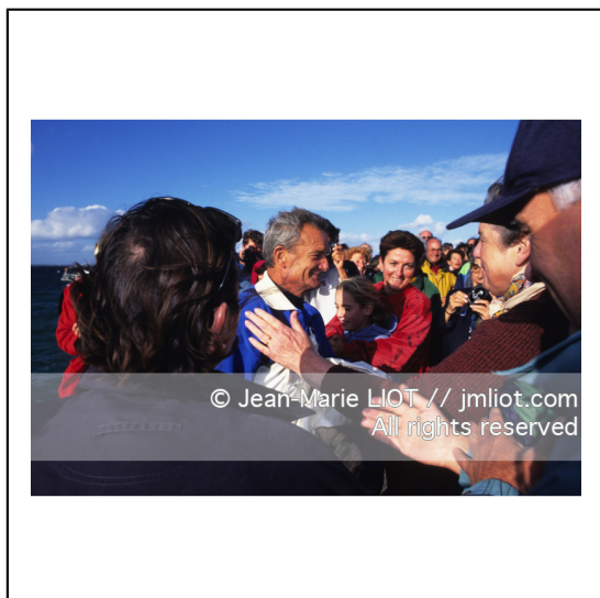
Septembre 1995, mise à l'eau de Pen Duick en présence de son skipper Eric tabarly, après rénovation par l'Ecole Nationale de Voile..Photo © Jean-Marie LIOT.###.September 1995, Launching Pen Duick with his skipper Eric tabarly, after complete refit by l'Ecole Nationale de Voile..Photo © Jean-Marie LIOT.