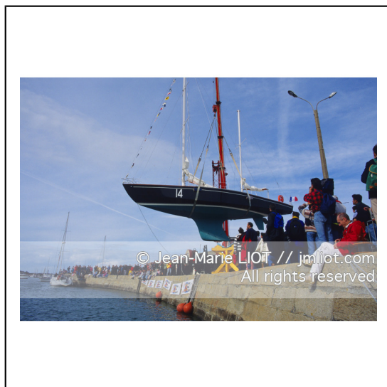
Septembre 1995, mise à l'eau de Pen Duick en présence de son skipper Eric tabarly, après rénovation par l'Ecole Nationale de Voile..Photo © Jean-Marie LIOT.###.September 1995, Launching Pen Duick with his skipper Eric tabarly, after complete refit by l'Ecole Nationale de Voile..Photo © Jean-Marie LIOT.