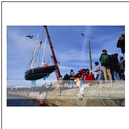
Septembre 1995, mise à l'eau de Pen Duick en présence de son skipper Eric tabarly, après rénovation par l'Ecole Nationale de Voile..Photo © Jean-Marie LIOT.###.September 1995, Launching Pen Duick with his skipper Eric tabarly, after complete refit by l'Ecole Nationale de Voile..Photo © Jean-Marie LIOT.