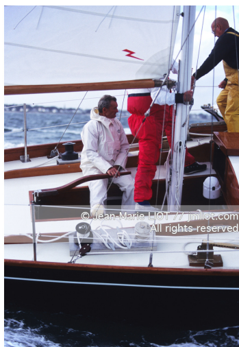
Septembre 1995, mise à l'eau de Pen Duick en présence de son skipper Eric tabarly, après rénovation par l'Ecole Nationale de Voile..Photo © Jean-Marie LIOT.###.September 1995, Launching Pen Duick with his skipper Eric tabarly, after complete refit by l'Ecole Nationale de Voile..Photo © Jean-Marie LIOT.