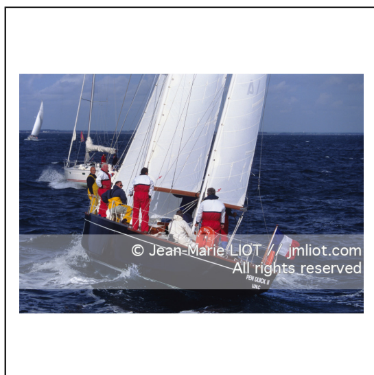
Septembre 1995, mise à l'eau de Pen Duick en présence de son skipper Eric tabarly, après rénovation par l'Ecole Nationale de Voile..Photo © Jean-Marie LIOT.###.September 1995, Launching Pen Duick with his skipper Eric tabarly, after complete refit by l'Ecole Nationale de Voile..Photo © Jean-Marie LIOT.